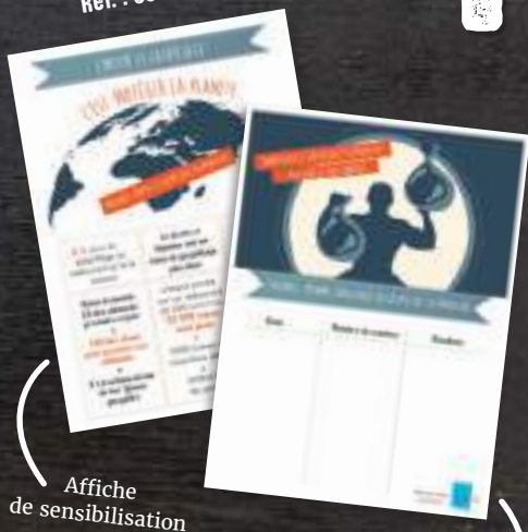
Affiche de sensibilisation