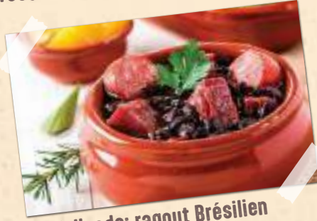
Feijoada: ragout Brésilien