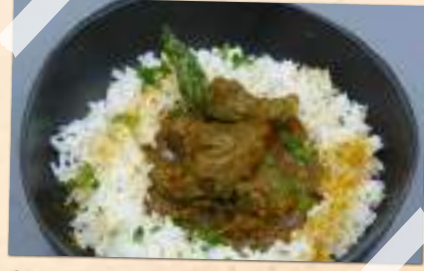
Curry d'agneau à l'indienne